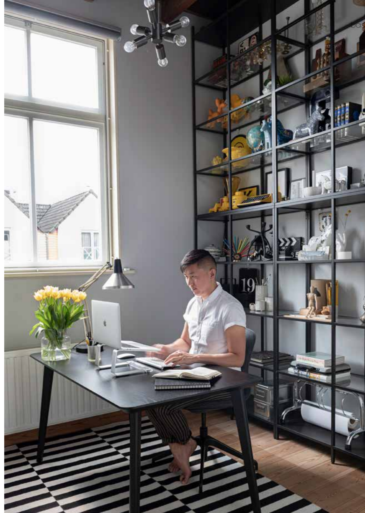
▲ Bureau, kled en stellingkast Ikea. Vintage bureaulamp Hala, hanglamp West Elm. Overige onder andere reissouvenirs, familiestukken, cadeaus, vintage voorwerpen en familiefoto's.

typisch DESIGN Een mix van luxe materialen, grafische patronen, kunstobjecten en bijzondere accessoires die een verhaal vertellen.