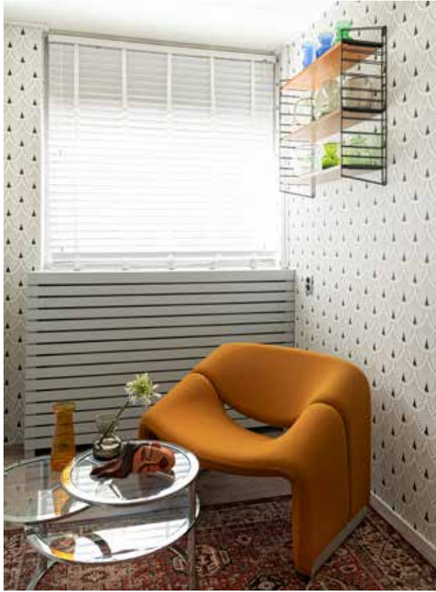
▲ Muur zingrijs, donkergroen mengkleur Karwei. Spiegel, plantenpot en tafel Ikea. Beeld en lamp Tolomeo van Artemide, beide via Marktplaats. ▲ Stoel Groovy Artifort, tafel en Tomado-rek via Marktplaats. Glaswerk en items op tafel rommelmarkt en Catawiki. Vloerkleed en behang Karwei.