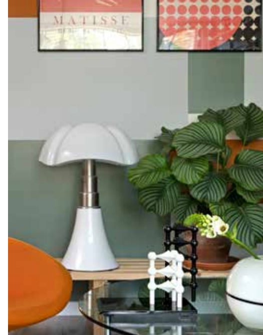
▲ Muur leemgroen en zinkgrijs Karwei. Lamp Pipistrello, tafel Gispen en stoel Marktplaats. Vaas en plankje kringloopwinkel. Lijsten Yourdecoration.

Wees niet bang voor grote planten, die brengen juist veel sfeer met zich mee. Varieer eens met verschillende bladkleuren en -groottes.