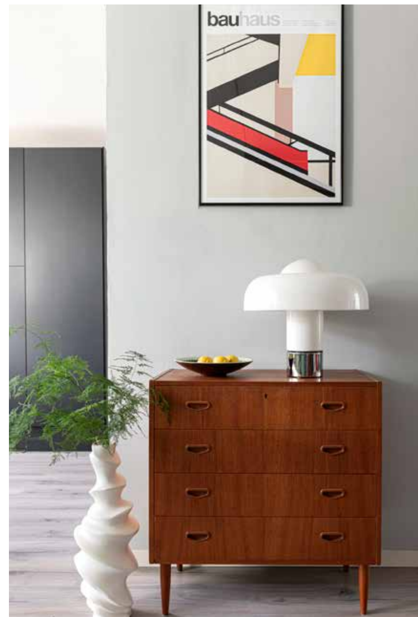
< Kastje en lamp Brumbry Guzzini via Marktplaats. Schaal West Germany rommelmarkt, vaas vanbob.nl. Lijsten Yourdecoration, poster pstr.studio.

"We genieten van de speurtocht naar originele designstukken"