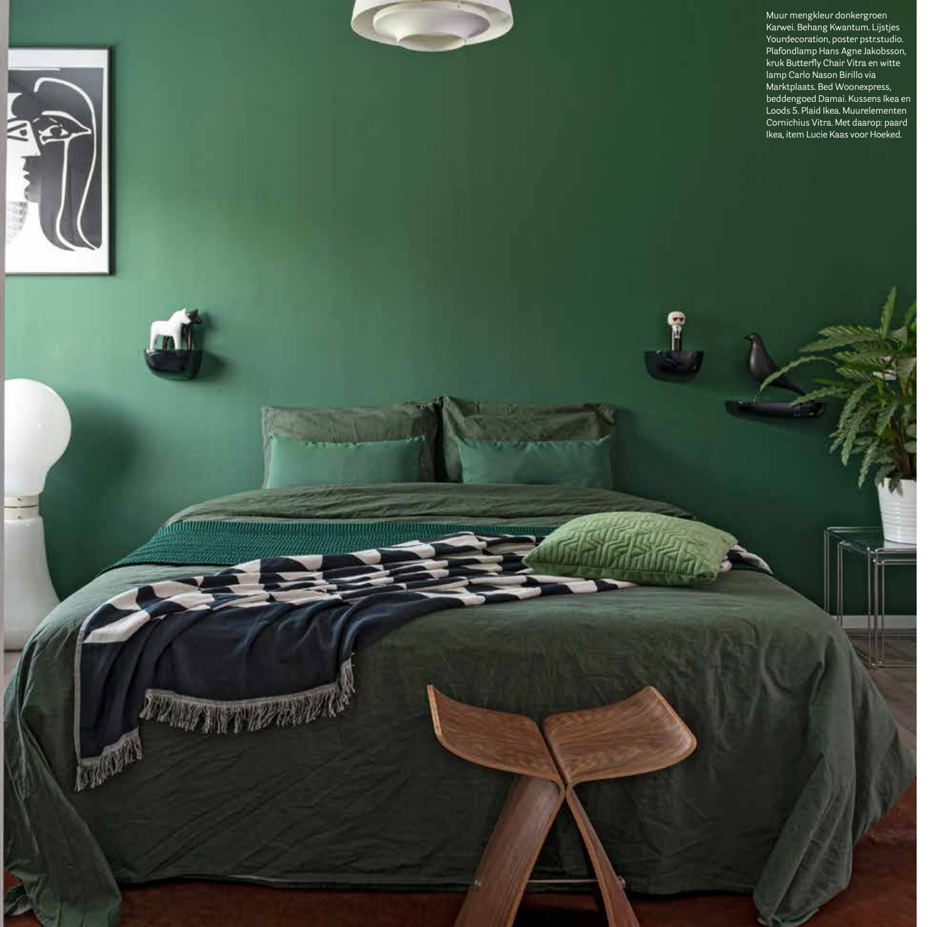
Muur mengkleur donkergroen Karwei. Behang Kwantum. Lijstjes Yourdecoration, poster pstr.studio. Plafondlamp Hans Agne Jakobsson, kruk Butterfly Chair Vitra en witte lamp Carlo Nason Birillo via Marktplaats. Bed Woonexpress, beddengoed Damai. Kussens Ikea en Loods 5. Plaid Ikea. Muurelementen Cornichus Vitra. Met daarop: paard Ikea, item Lucie Kaas voor Hoeked.