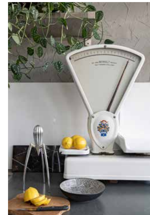
▲ Weegschaal rommelmarkt, sinaasappelpers Alessi, houten plank Xenos, mes Ikea, schaal tje onbekend.